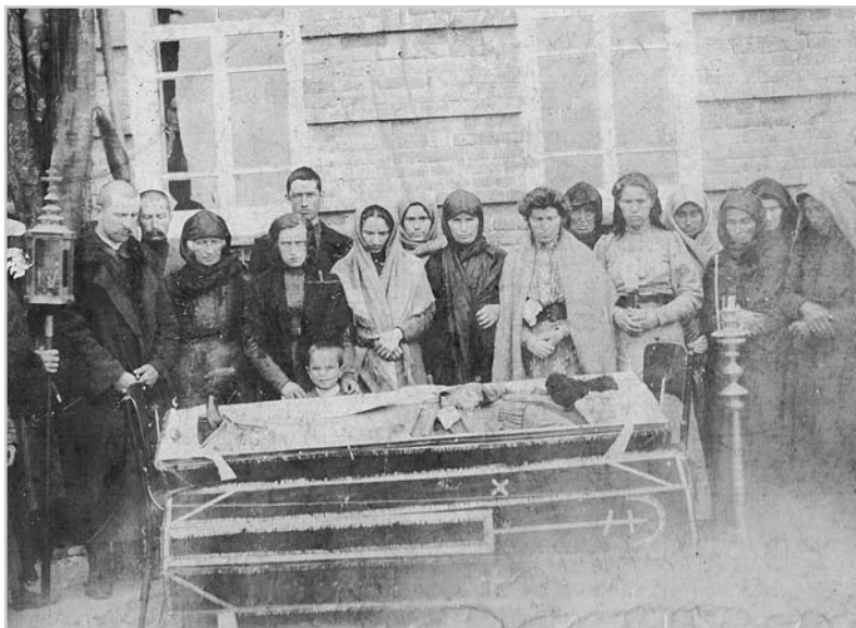
Саламты Казмагомеды зианы уæлхъус. 15 апрель 1908 аз. Æрыдон.

Æрæджы Хъасболаты фырт Хъантемыр сæ хъæуы зианы бон сыхы æмæ хъæубæсты номæй уыди дзурæг лæг. Ныхас куы фæци, уæд мæ цурмæ