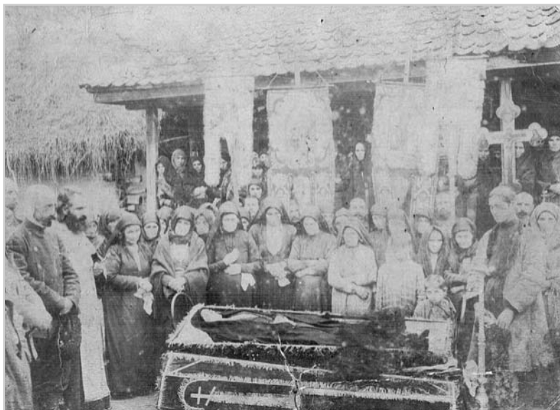
Хапсæты Дзеккайы зианы уæлхъус. 1879аз. Æрыдон.

РЕДАКЦИЙÆ: Худ исгæ у кувæндонны бын, аргъуаны, æмæ уыцы æгъдау зианы, фыдохы æгъдауимæ хæцæм кæнын нæ хъæуы. Марды уæлхъус худ исын кæй нæ хъæуы, нæ фыдæлтæ йæ кæй нæ истой, уый тынг бæлвырдæй зыны Тугъанты Махарбеджы ныу "Бæхфæлдисæны", Къостайы уацмыс "Уæлмæрдты"-мæ гæсгæ конд. Махарбег Санаты хæрæфырт уыд, фылдæр йæ мады æрвадæлтæм хъомыл кодта. Æгъдау федта ир æмæ дыгурмæ дæр. Стæй Къоста дæр бæхфæлдисæг зæронд лæггæй фысы: "Гасæй йæ уæлæ хæлын худ"... Раздæр та мардмæ æнæ худæй ничи цыди.